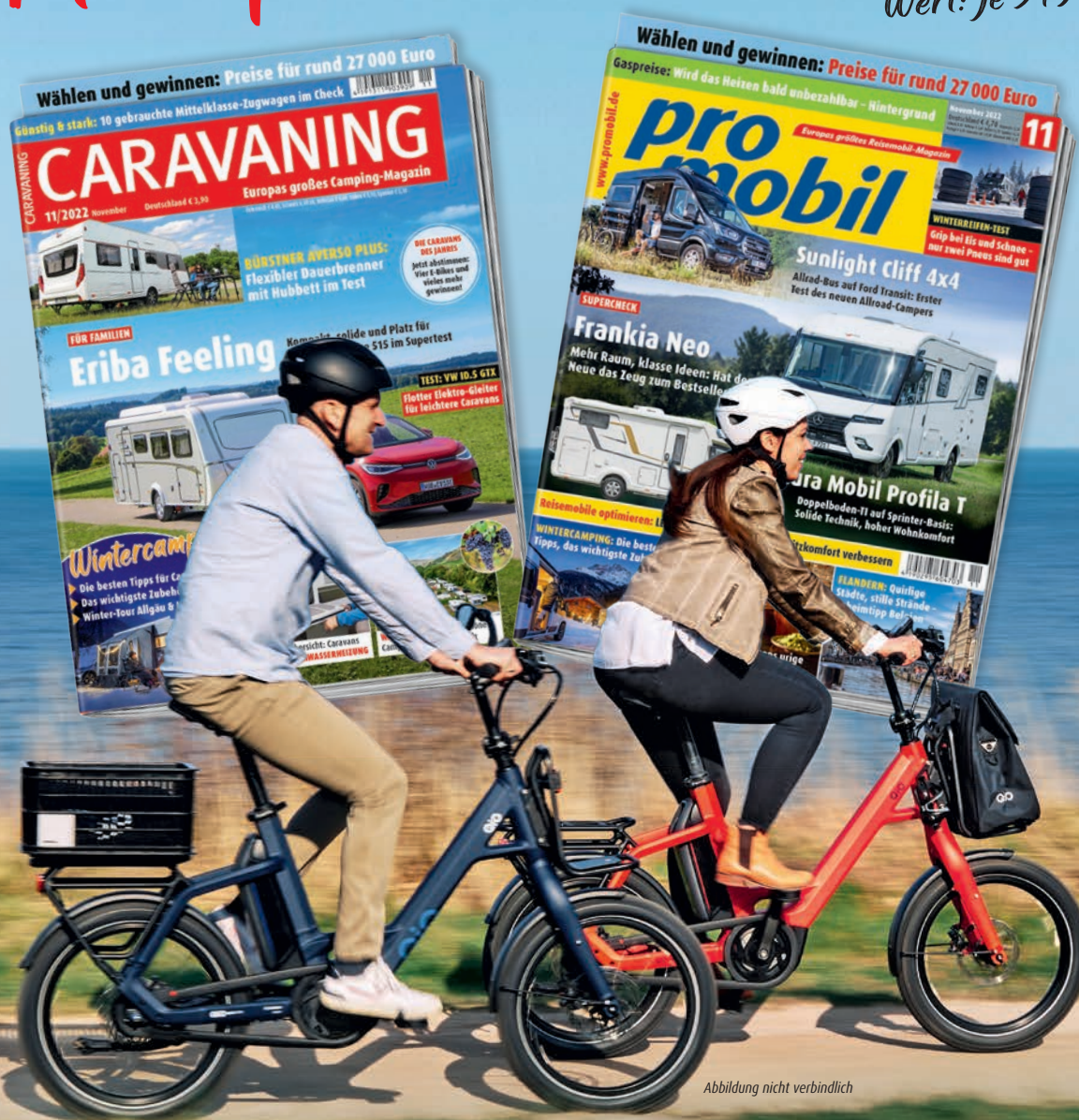
Abbildung nicht verbindlich

Jetzt mitmachen und vier Kompakt-E-Bikes gewinnen! Wert: je 3499 Euro